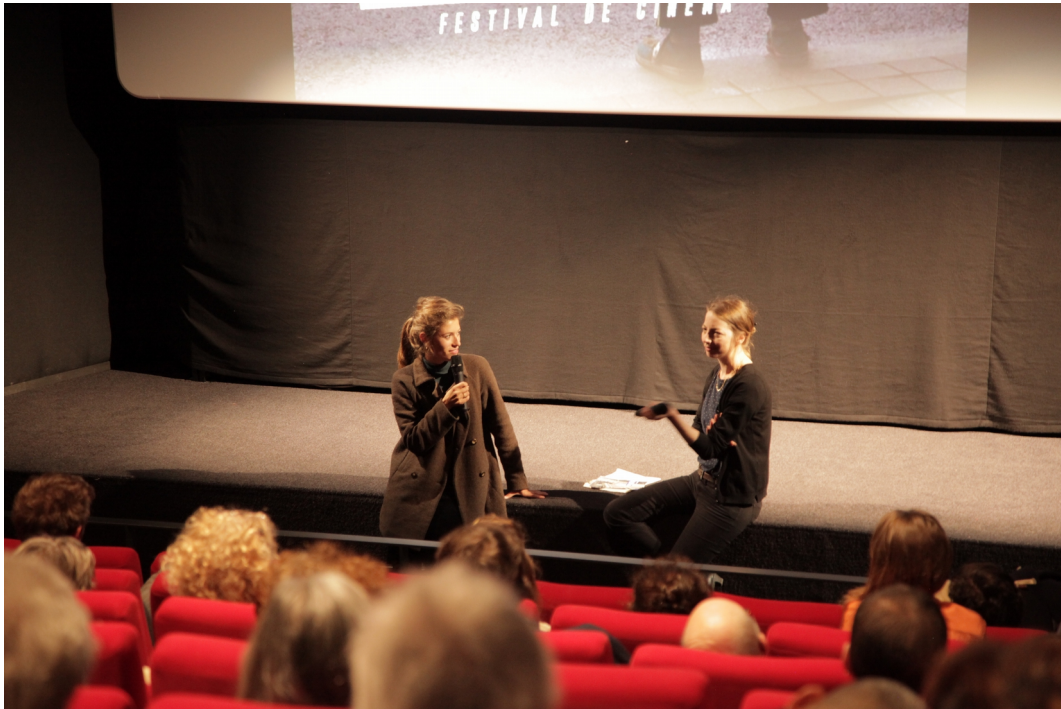
Rencontre avec Lucie Martin après la projection, en avant-première, de son film Demeure